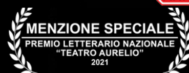
ILLUSTRAZIONE DEL PROGETTO

A NAKED LOVE è un'opera teatrale per adulti.